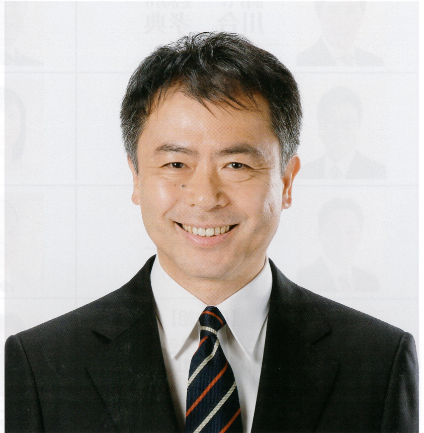
宮城選挙区 民進党 予定候補者 現職3期 60歳 連合宮城推薦

公職選挙法が改正され、7月の参院選から18歳以上が投票可能に。各構成組域は、18歳新卒組合員にも忘れずに声掛けしましょう!